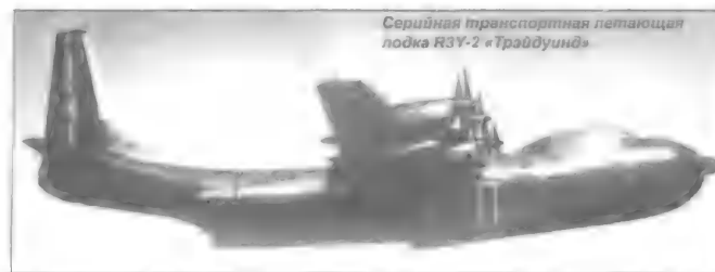
Серийная транспортная летающая лодка R3Y-2 «Трэйдуинд»

При максимальном взлетном весе в 63 т он разогнался до 624 км/ч на высоте в 9 км и имел дальность в 4500 км.